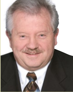
ROGER GAUDET Député de Montcalm Bloc Québécois

2822, ch. Sainte-Marie, C.P. 76060 Mascouche (Québec) J7K 3N9 Téléphone : 450 474-1044, 1 800 263-5726 Télécopieur : 450 474-1585 Courriel : gaudero1@parl.gc.ca