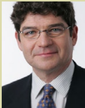
PIERRE A. PAQUETTE Député de Joliette Leader parlementaire du Bloc Québécois

398, rue Baby Joliette, Québec J6E 2W1 Téléphone : 450 752-1940, 1 800 265-1940 Télécopieur : 4450 752-1719 Courriel : paquep1@parl.gc.ca