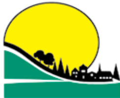
Municipalité de Sainte-Émélie-de-l'Énergie