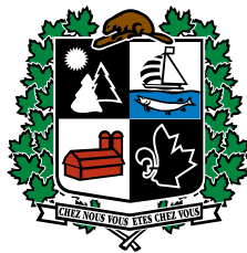
Municipalité de Saint-Gabriel-de-Brandon