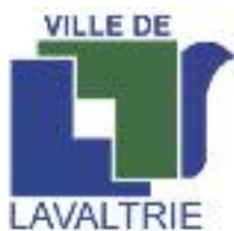
Ville de Lavaltrie