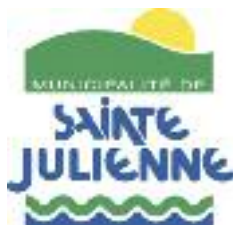
Municipalité de Sainte-Julienne