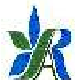
Municipalité de Saint-Roch-de-L'Achigan